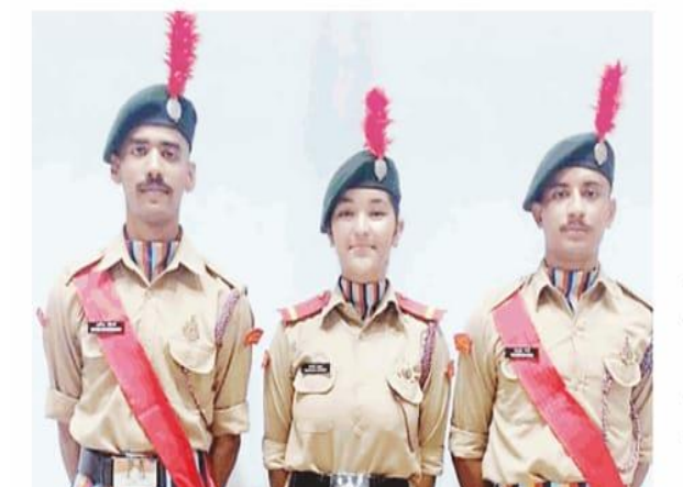
सुंदरनगर : एडवांस लीडरशिप कैंप देहरादून के लिए चयनित तीनों एन.सी.सी. कैडेटस।

र्गात TUE,12 SEPTEMBER 2023 EDITION: MANDI KESARI, PAGE NO. 2